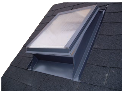
Obr. č. 1b