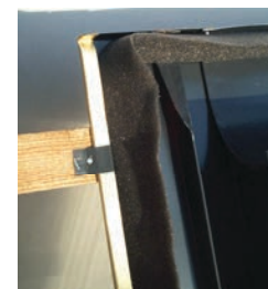
Obr. č. 2b