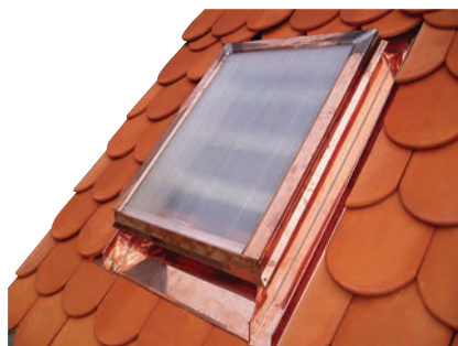
Obr. č. 1c