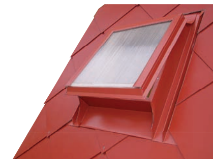
Obr. č. 1d